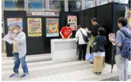
KIBUN PACHI-PACHIブースでトリプルスタンブラーに参加する来場者も多かった