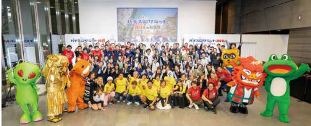
イベントをサポートした日電協加盟ホール企業のスタッフとの記念撮影

パチスロサミット2024には日電協加盟企業からホールスタッフ90人が参加して来場者をもてなした。