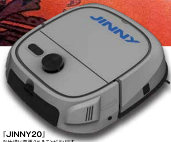
『JINNY20』 ※仕様は変更されることがあります

ビルメンテナンス事業を手掛けるエムエムインターナショナル(東京都)は11月末、人に代わって床清掃を完璧にこなす清掃ロボットを販売する。従来の課題はすべてクリア。他業界からも注文が殺到することは必至で、数に限りがある年内納品分は先着順になりそうだ。