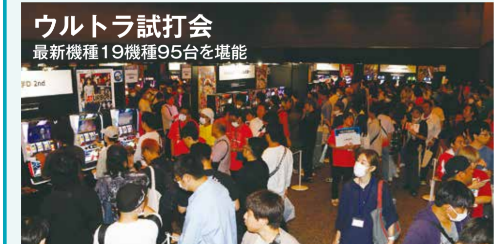
地下1階ではパチスロ最新機種19機種95台を揃えたウルトラ試打会を開催。日遊協加盟ホール企業のホールスタッフが親切にアテンドするなか、1673人(主催者発表)の来場者が最新のパチスロを堪能した。