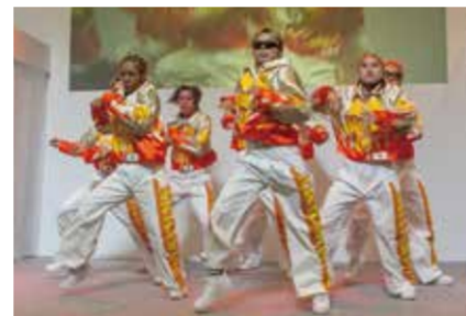
オープニングを飾ったSEGA SAMMY LUXのダンス