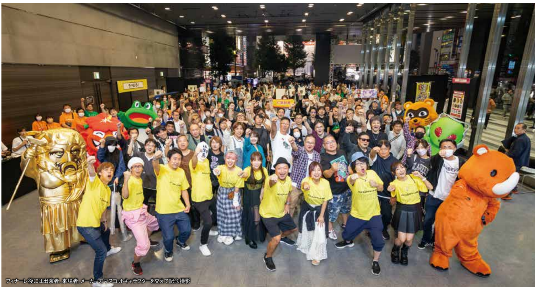
フィナーレ後には出演者、来場者、メーカーのマスコットキャラクターを交えて記念撮影

あいにくの雨模様となった土曜日の秋葉原。しかし雨をもとめず、ベルサール秋葉原には多くの来場者で賑わった。当日の総来場者数は8,899人、生配信したYouTubeの視聴数も74,401人。いずれも主催者の発表だった。