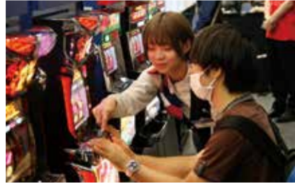
タッチ&トライコーナーではホールスタッフが初心者寄り添ってアテンド