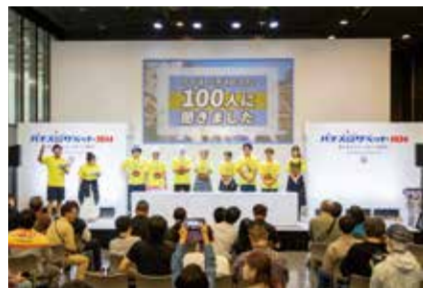
人気ライターがステージを盛り上げた